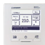
RC-EX3N контроллер для НМУ-КИТ