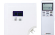
RCN-TC-5AW-E2, -E3 БЕСПРОВОДНОЙ